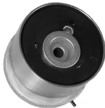
Fig. 2 Nouvelle conception

la nouvelle version n'a dorénavant plus de goupille fendue et doit d'abord être serrée dans le sens des aiguilles d'une montre après sa pose sur le moteur (20 Nm + 120°), au moyen d'une clé à six pans de 6 mm, avant de pouvoir installer la courroie. Lorsque l'on retire la clé à six pans, la tension se règle automatiquement.